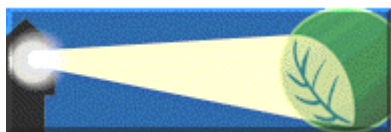
Mynd 7. Miljöfyrtaarn. (Umhverfisvitinn). Umhverfismerki fyrirtækja í Kristiansand og fleiri norskum sveitarfélögum. 62

Aðstandendur: Sveitarfélagið Kristiansand í Noregi hleypti verkefninu af stokkunum 1996 sem hluta af Staðardagskrárstarfinu í sveitarfélaginu. Ári síðar var ákveðið að veita öðrum norskum sveitarfélögum aðgang að kerfinu. Frá og með árinu