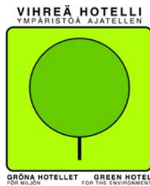
Mynd 14. Merki Green Hotel 88