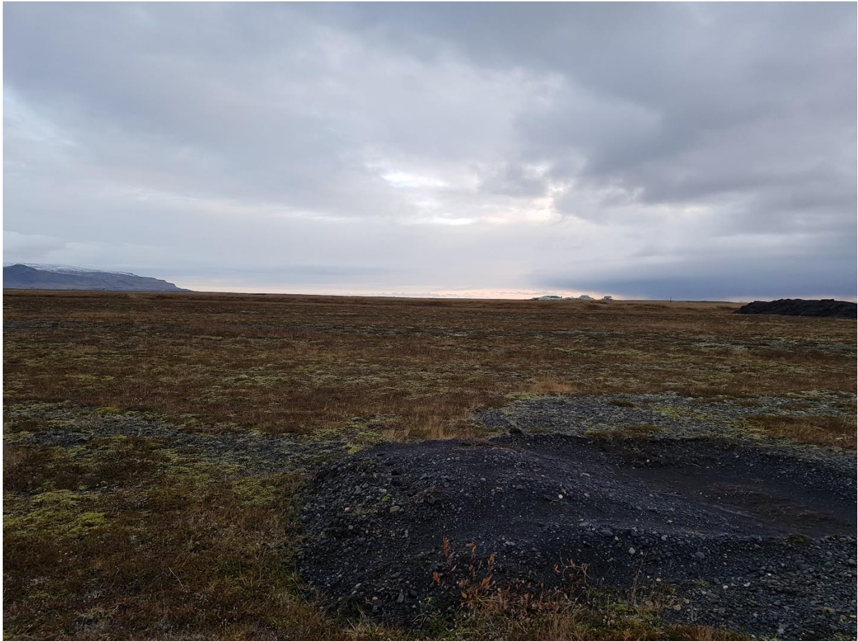
Mynd 4.2: Gróðurþekju á framkvæmdasvæði.

Beint rask verður á því svæði sem fyrirhugað er að nýta til efnistöku. Þar mun gróður, jarðlög og fleira verða fyrir varanlegu raski. Samkvæmt kortagrunni Náttúrufræðistofnunar Íslands um sérstaka vernd 9 er framkvæmdasvæðið ekki innan marka stærri votlendissvæða og nýtur því ekki verndar skv. 61. gr laga um náttúruvernd nr. 60/2013. Skv. vistgerðakorti Náttúrufræðistofnunar Íslands eru auravist og starmóavist ráðandi á svæðinu og eru verndargildi þeirra metið miðlungs. 10,11,12 Ekki er talið nauðsynlegt að gera nánari grein fyrir gróðri og vistgerðum í frummatsskýrslu.