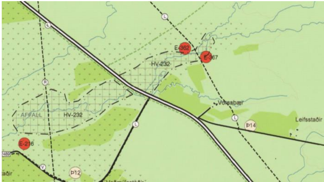
Mynd 3.1: Úr gildandi aðalskipulagi Rangárþings eystra – Vorsabæjarnáma (nr. E-367)