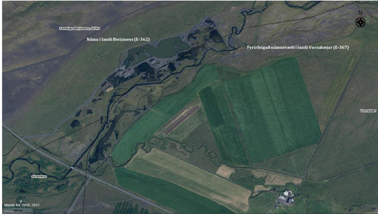
Mynd 1.2. Loftmynd af framkvæmdasvæði.