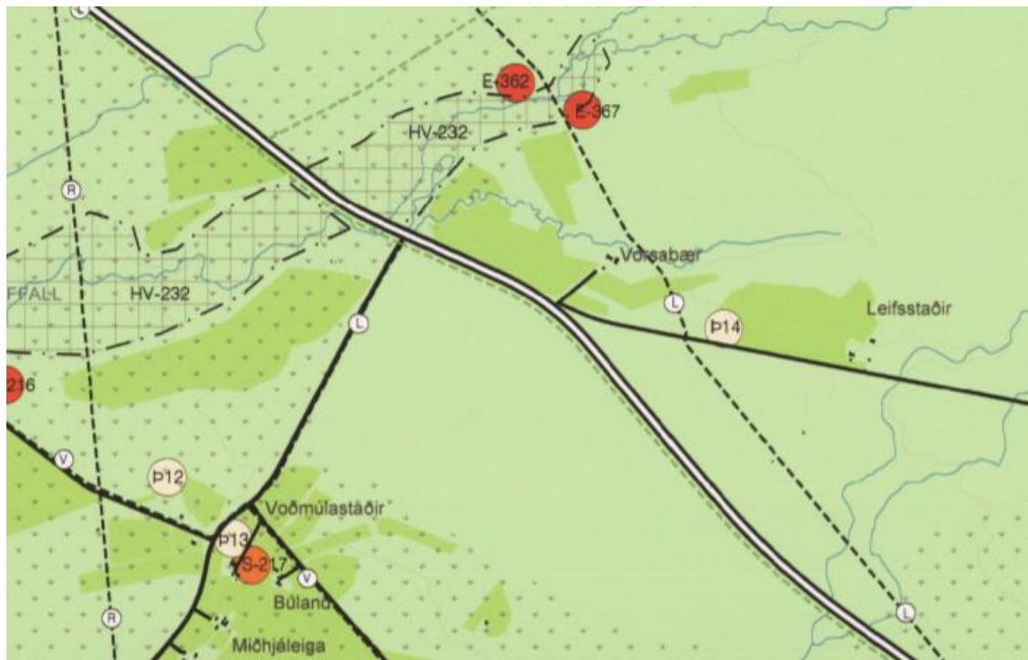
Mynd 4.1: Friðlýstar fornleifar á sveitarfélagsuppdrætti, (Þ12, Þ13 og Þ14).

Ekki er talin þörf á að fjalla frekar um fornleifar í frummatsskýrslu.